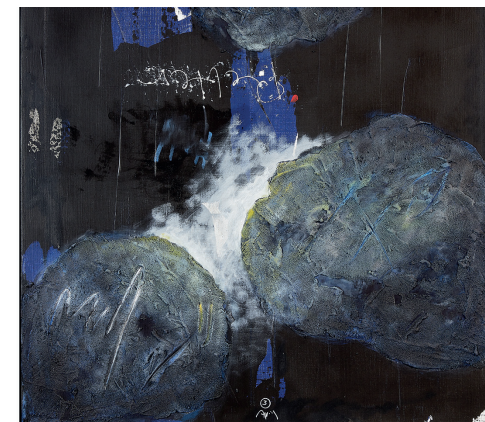
Uwe Appold, Unser Retter der Tod – Reproduktion: Olff Appold